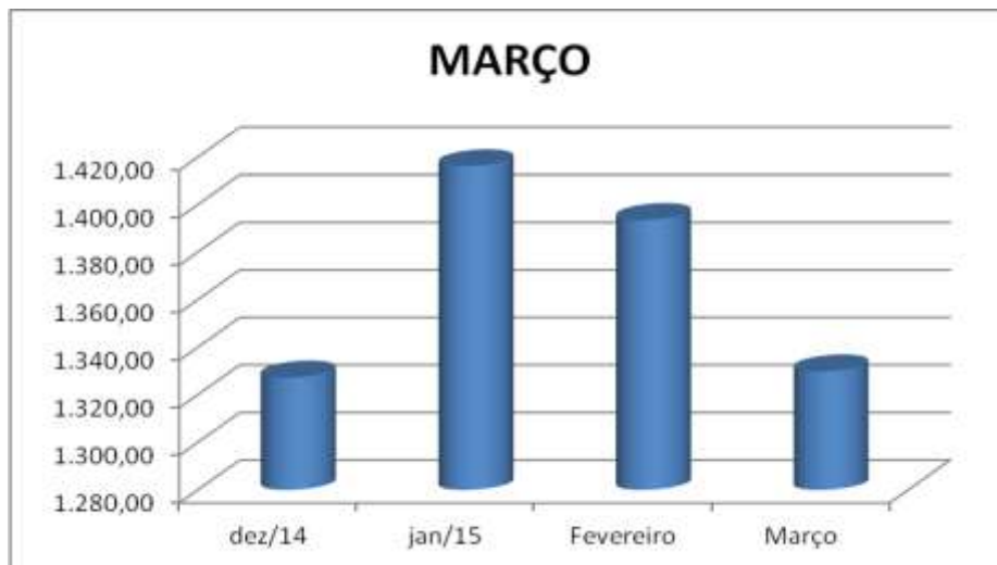
GRÁFICO COMPARATIVO EM MOEDA REAL